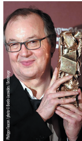
Philippe Faucon

Le réalisateur français Philippe Faucon , qui a obtenu le César 2016 du meilleur film, pour Fatima , nous dit pourquoi il soutient notre festival.