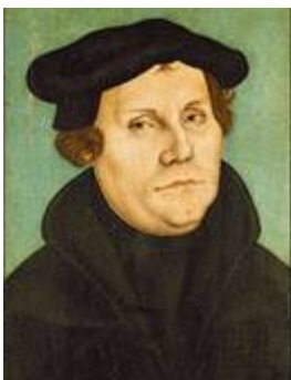
Martin Luther (1483-1546)

Commencée par Martin Luther en Allemagne et Ulrich Zwingli à Zurich, puis Martin Bucer à Strasbourg et, plus tard, Jean Calvin à Paris et Genève, la Réforme touche la majeure partie de l'Europe du Nord-Ouest. Les tentatives de conciliation ayant échoué, elle aboutit à une scission entre l'Église catholique romaine et les Églises protestantes. La Réforme catholique engagée à l'issue du Concile oecuménique de Trente (1545 - 1563) ne permet à l'Église catholique qu'une reconquête partielle des populations passées au protestantisme.