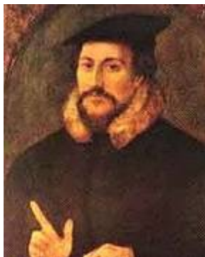
Ulrich Zwingli (1484-1531)