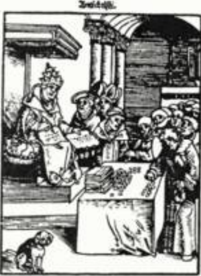
Le Pape signant et vendant des indulgences vu comme l'Antéchrist par Lucas Cranach l'Ancien d'après le Passional Christi und Antichristi de Martin Luther (1521).

Amorcée dès le XV ème siècle et culminante au XVI ème siècle, la Réforme protestante est une volonté d'un retour aux sources du Christianisme et aussi, par extension, un besoin de considérer la religion et la vie sociale d'une autre manière. Elle reflète l'angoisse des âmes par la question du salut, centrale à l'époque, et dans la réflexion des réformateurs qui dénoncent la corruption de toute la société engendrée par le commerce des indulgences.