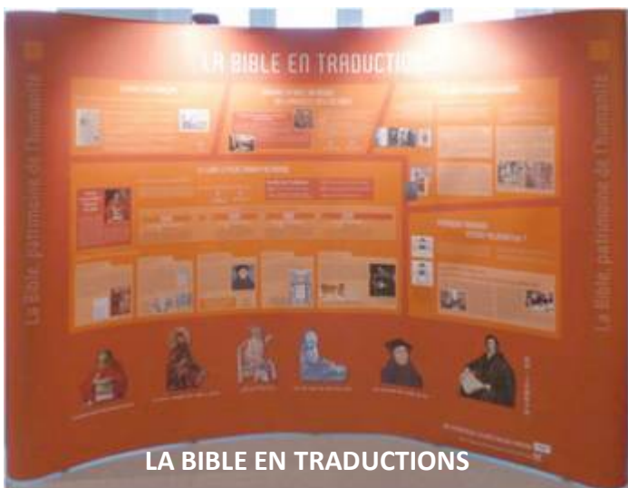
LA BIBLE EN TRADUCTIONS