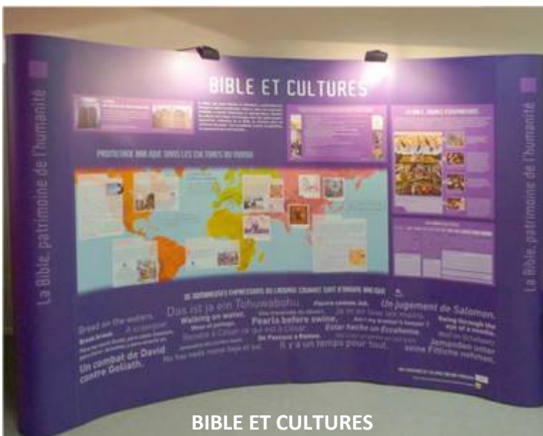
BIBLE ET CULTURES