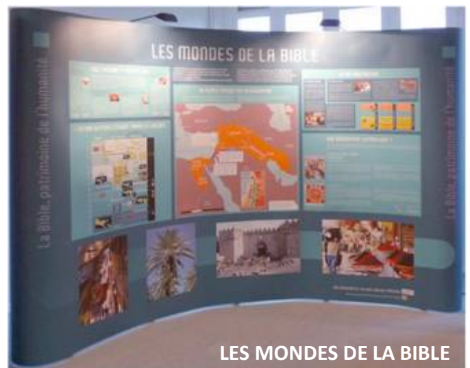
LES MONDES DE LA BIBLE