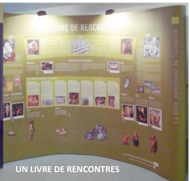
UN LIVRE DE RENCONTRES