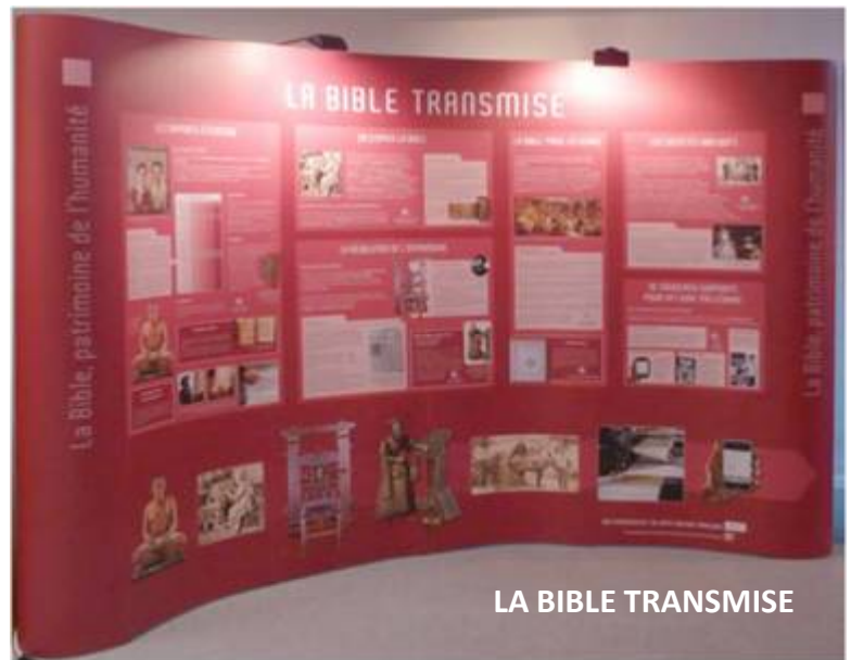
LA BIBLE TRANSMISE