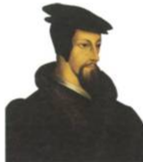
Jean Calvin (1509-1564)