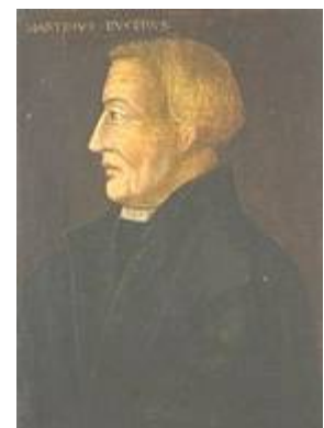
Martin Bucer (1491-1551)